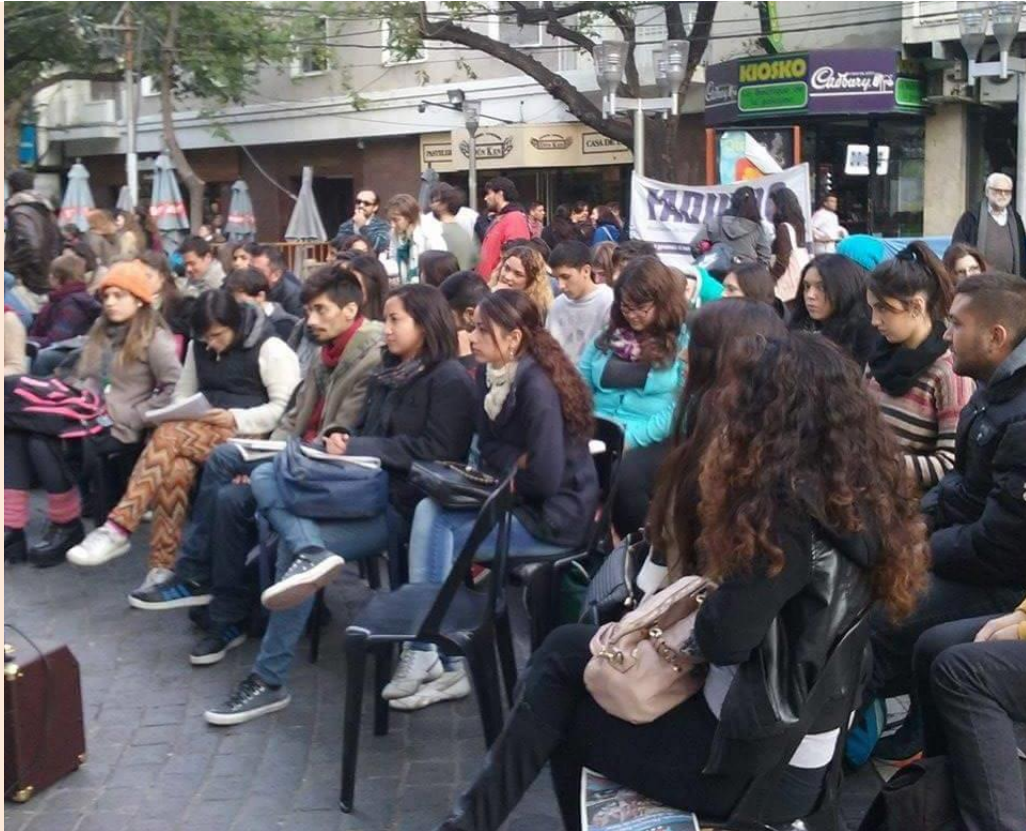
29 Caravanazo convocado por la Intersindical de Mendoza. abril