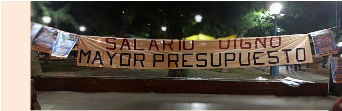
1 mayo Acto del 1 de mayo , Día del Trabajador convocado por la Intersindical de Mendoza.