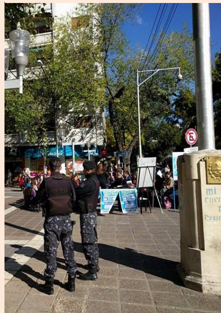
Y en San Rafael ...