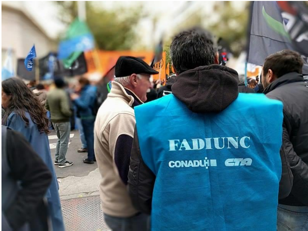
En San Rafael , clases públicas, volanteada y recorrido por la ciudad.