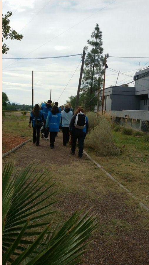
Clases públicas en la Plaza Independencia y Ciudad Universitaria.