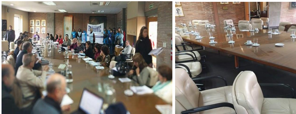
Asamblea general Extraordinaria, FEEyE.