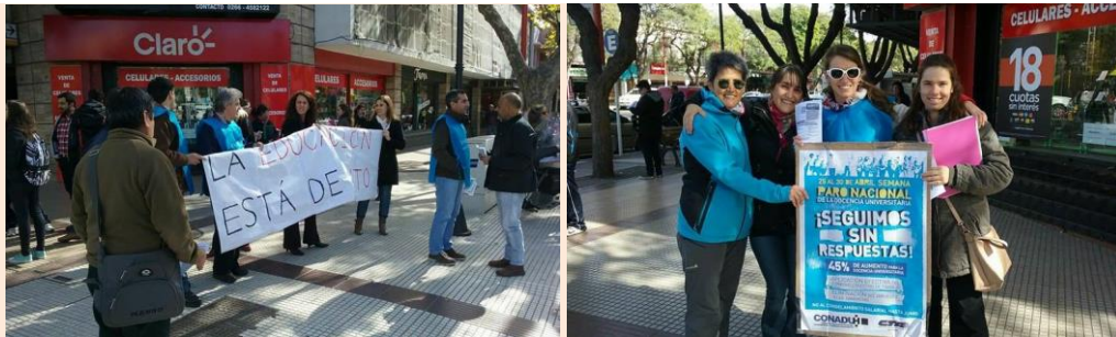
27 Reunión del Consejo Superior. Rectorado. 10 hs. abril